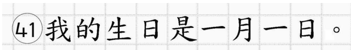
Рис.18. Образец написания иероглифических знаков

Бланк ответов № 2 (лист 1 и лист 2) по китайскому языку (рис. 16 и рис. 17) предназначен для записи ответов на задания с развернутым ответом по китайскому языку (строго в соответствии с требованиями инструкции к КИМ ЕГЭ и к отдельным заданиям КИМ ЕГЭ). Каждый иероглифический знак и каждый знак препинания следует писать внутри отдельной клетки в поле ответов бланка ответов № 2 (дополнительного бланка ответов № 2) (рис. 18).