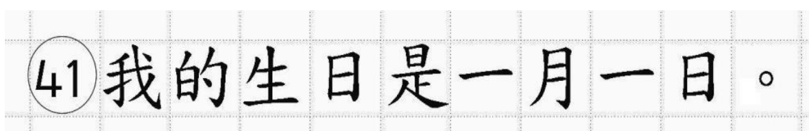
Рис.16. Образец написания иероглифических знаков

Бланк ответов № 2 (лист 1 и лист 2) по китайскому языку (рис. 14 и рис. 15) предназначен для записи ответов на задания КИМ для проведения ЕГЭ с развернутым ответом по китайскому языку (строго в соответствии с требованиями инструкции к КИМ для проведения ЕГЭ и к отдельным заданиям КИМ). Каждый иероглифический знак и каждый знак препинания следует писать внутри отдельной клетки в поле ответов бланка ответов № 2 (дополнительного бланка ответов № 2) (рис. 16).